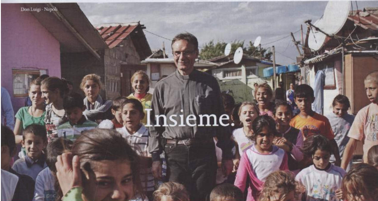
Don Luigi - Napoli